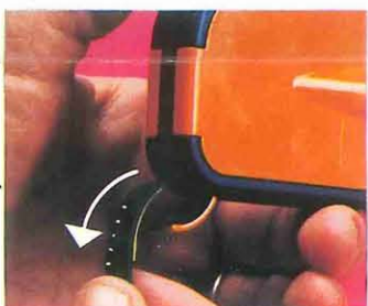
9 Para sacar la película, abrir la trampilla entrada/salida película; siga pulsando hasta que no avance más y tire del extremo de la película que ya ha salido.