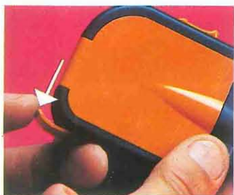
5 Abrir trampilla entrada/salida película. Introducir la película en la ranura por el ex-