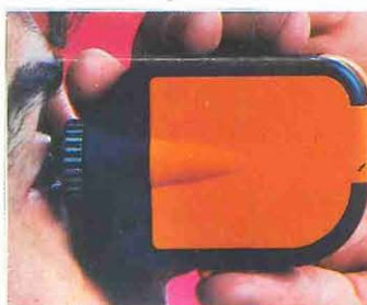
10 Para utilizar el LOOKMOVIE como visor, bastará girarla al revés, mirando por el objetivo.