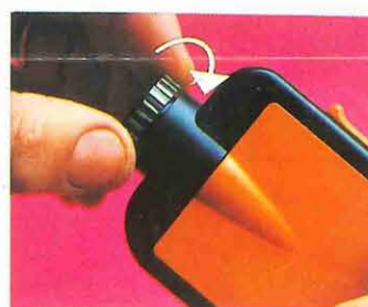
11 Girando el objetivo, regulará el entoque.