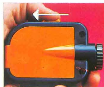
4 Situar el pulsador hacia atrás.