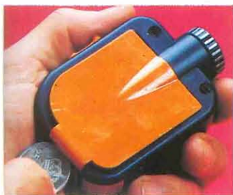
1 Abrir la tapa lateral derecha.