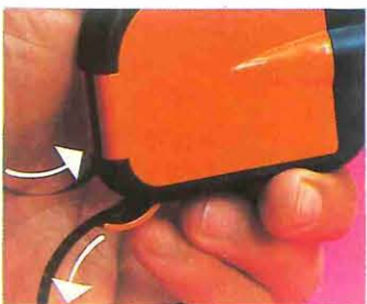
12 Para ver películas de Super 8m/m de mayor longitud, siga las mismas instrucciones que en la película LOOKFILM dejando la trampilla entrada/salida película abierta.