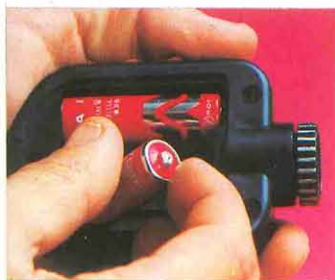
2 Introducir pilas (2 de 1,5 V. tipo transistor). 3 Cerrar la tapa.