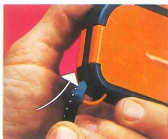
tremo en forma de flecha, quedando las perforaciones a la izquierda. 6 Ir introduciendo hasta la mitad de la película aproximadamente. 7 Cerrar la trampilla entrada/salida película.