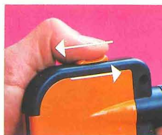
8 Comenzar la proyección, accionando el pulsador hacia adelante. Para pasar al próximo fotograma, accionar el pulsador hacia atrás y volverlo hacia adelante, y así sucesivamente.